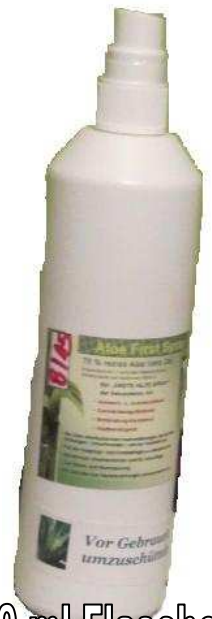
250 ml Flasche

Aloe Vera Gel zu min. 78 %, Allantoin, Bienen Propolis, Extrakte aus Ringelblume, Scharfgarbe, Thymian, Kamille, Löwenzahn, Eukalyptus, Passionsblume, Salbei, Ingwer, Borretsch, Sandelholz.